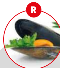
R WEICHTIERE WIE SCHNECKEN, MUSCHELN, TINTENFISCHE UND DARAUS GEWONNENE ERZEUGNISSE