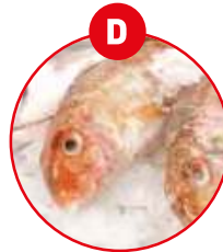
D FISCH UND DARAUS GEWONNENE ERZEUGNISSE (AUSSER FISCHGELATINE)