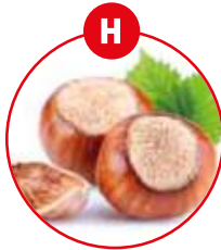
H SCHALENFRÜCHTE UND DARAUS GEWONNENE ERZEUGNISSE