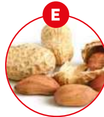
E ERDNÜSSE UND DARAUS GEWONNENE ERZEUGNISSE