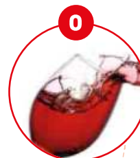
O SCHWEFELDIOXID UND SULFITE