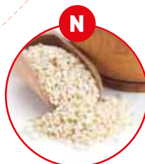
N SESAMSAMEN UND DARAUS GEWONNENE ERZEUGNISSE