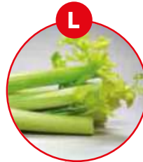
L SELLERIE UND DARAUS GEWONNENE ERZEUGNISSE