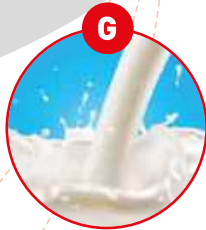
G MILCH VON SÄUGETIEREN UND MILCHER- ZEUGNISSE (INKLUSIVE LAKTOSE)