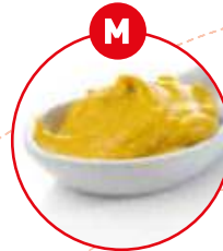
M SENF UND DARAUS GEWONNENE ERZEUGNISSE