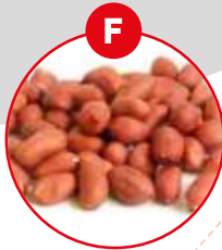
F SOJABOHNEN UND DARAUS GEWONNENE ERZEUGNISSE