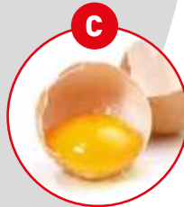
C EIER VON GEFLÜGEL UND DARAUS GEWONNENE ERZEUGNISSE